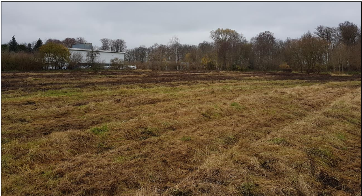
Abbildung 1: Blick auf den Planungsraum vom Neustädter Damm in Richtung Nordwesten (Baukonzept Neubrandenburg GmbH Oktober 2017)

Im Oktober 2017 wurde die Fläche erstmals seit längerer Zeit gemäht. Einzelsträucher mit geringer Wertigkeit für den Arten- und Biotopschutz wurden gerodet. Wertgebende Gehölze und Bäume im Westen und Norden des Planungsraumes sollen hingegen erhalten bleiben.