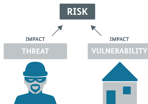
Abbildung 1: Ermittlung des Risikos im Rahmen der Nationalen Risikoanalyse Deutschlands. Analyse der Bedrohung (Threat) und der Verletzlichkeit (Vulnerability).

Die Bewertung des Risikos steht im Rahmen dieser Analyse im Einklang mit den Anforderungen des risikobasierten Ansatzes der FATF-Empfehlung 1. Das Risiko für Geldwäsche und Terrorismusfinanzierung setzt sich daher im Rahmen dieser Untersuchung aus dem jeweiligen Bedrohungspotential sowie der korrespondierenden Verletzlichkeit (bzw. Anfälligkeit) Deutschlands zusammen.